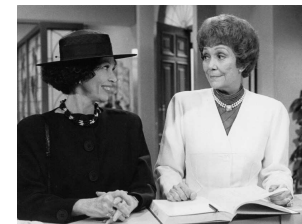
Leslie Caron und Jane Wyman in der Premiere von Staffel 7.