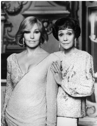
Kim Novak und Jane Wyman in Saison 6.

Gibt es Mitglieder der Besetzung und des Produktionsstabs, mit denen du besondere Erinnerungen verbindest?