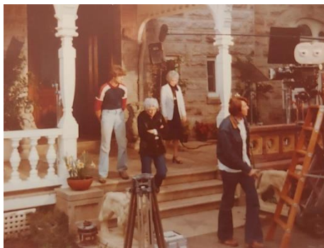
Vorbereitungen für Akt 4, Szene 62 auf der Veranda des Herrenhauses von Spring Mountain : Jane Wyman (Mitte) und Mitarbeiter von Lorimar .

Hast du dir Falcon Crest angesehen? Wenn ja, was hast du über die Unterschiede zwischen The Vintage Years und der überarbeiteten Serie gedacht?