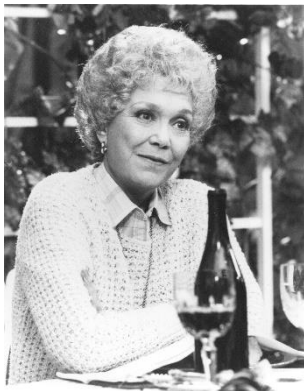
Jane Wyman während der erwähnten Szene in dem von Lorimar hinter der Villa Miravalle eigens errichteten Pavillon.