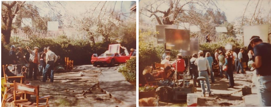
Dreharbeiten auf Chateau Chevalier am 11. März 1981 für Akt 3, Szene 50.

Stehst du noch immer in Kontakt mit jemandem von den Schauspielern oder der Crew? Nein.