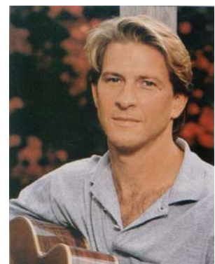
Tiefe Eindrücke von Gaststars und Hauptdarstellern: Leslie Caron, Kim Novak, Lorenzo Lamas und Brett Cullen.