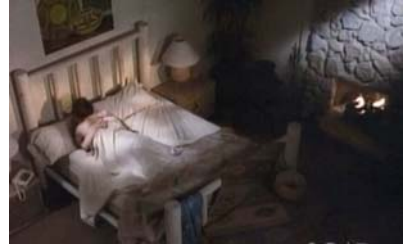
Richards und Maggies geplätzte Hochzeit und ihre Whirlwannen-Nacht in ihrem Schlafzimmer im indianisch inspirierten Stil à la Santa Fe, eine Studiokulisse, die wunderbar dem Design des echten Drehorts, Saddlerock Ranch , ähnelt.

„Und hinter den Kulissen?“ bezog ich mich unausweichlich auf andere besondere Anekdoten vom Set oder aus dem Produktionsbüro.