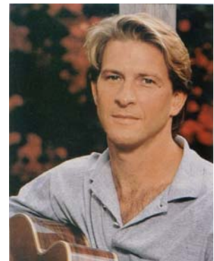
Tiefe Eindrücke von Gaststars und Hauptdarstellern: Leslie Caron, Kim Novak, Lorenzo Lamas und Brett Cullen.